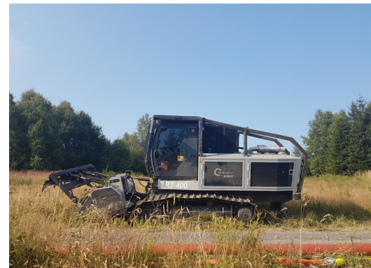
Forst(Schlegel)-Mulcher mit Kettenantrieb

Es gibt zwei Grundbauarten von Mulchmähern: Kreisel- bzw. Sichelmulcher und Schlegelmulcher. Beim Sichelmulcher erfolgt der Mäh- und Zerkleinerungsvorgang durch schnell rotierende waagerechte Messer. Zum leichteren Herummähen um Bäume oder Zaunpfähle sind Sichelmulcher auch mit hydraulischer gesteuerter Arbeitsbreitenänderung durch Einschwenken eines Teiles des Mähers (sogenannte Stockräumer) erhältlich. Beim Schlegelmulcher ist das Arbeitsorgan eine sich schnell entgegengesetzt der Fahrtrichtung drehende Welle (Drehzahl ca. 2.300/min) mit zahlreichen spiralförmig an der Welle beweglich befestigten und robust ausgeführten Messern, den sogenannten Schlegeln. Der Leistungsbedarf eines Schleppers mit Schlegelmulcher ist mit 180 bis 500 PS recht hoch. Vorteilhaft beim Schlegelmulcher ist jedoch, dass aufgrund der robusten Ausführungsart der Schlegel Äste und kleine Holzstücke mitverarbeitet werden können und Steine keine Schäden an der Maschine hervorrufen. Durch den am leistungsstarken Traktor angebauten Forstmulcher kann sowohl liegendes als auch stehendes Holzmaterial zerkleinert werden. Dabei kann stehendes Material von bis zu 15 cm Durchmesser bearbeitet werden. Die Bäume werden dabei in einem Arbeitsgang um gedrückt und zerkleinert.