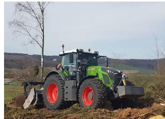
Forst(Schlegel) -Mulcher am Schlepper (415PS)