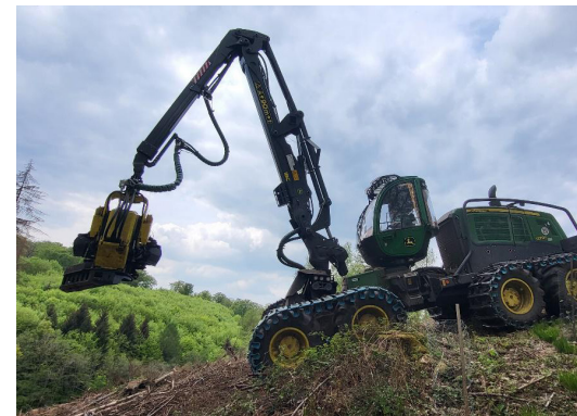
Harvester John Deere 1270 G mit Traktions- und Tragbändern

Sie bestehen aus Vorder- und Hinterwagen, die durch ein Knickgelenk verbunden sind. In der Regel trägt der Vorderwagen Kabine und Ausleger mit Vollerntheaggregate, der Hinterwagen den Motor. Die Ausleger haben Reichweiten von ca. 5 - 10 m. Üblich sind Fahrgestelle mit 4, 6 oder 8 Rädern. Im steilen Gelände können die Räder mit Gleitketten oder sogenannten Traktions-Tragbändern ausgestattet werden. Der Antrieb der konventionellen Fahrgestelle erfolgt über Hydrostatische. Der Harvester arbeitet Holz (Kurzholz) in Längen bis zu 6 m auf und legt die ausgehaltenen Sorten getrennt am Rückegassenrand ab. Mit dem Harvester ist es auch möglich Langholz aufzuarbeiten. Dies ist in Durchforstungsbeständen aufgrund der geringen Leistung (Vorankommen bzw. Stückleistung FM / Std.) nicht zu empfehlen.