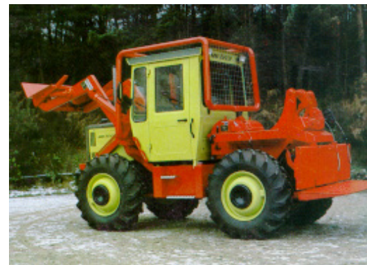
Systemschlepper (MB-Trac) mit Forstausrüstung