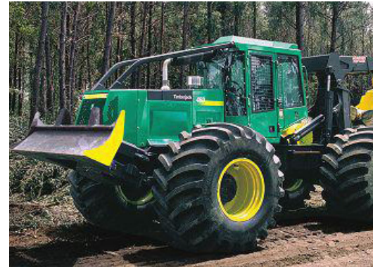
Grapple-Skidder Timberjack 548

Der Einsatzschwerpunkt von Forstschleppern ist das Rücken und Vorrücken von Laub- und Nadelholz in langer Form im ebenen bis schwach hängigem Gelände. Diese Maschinen sollten nicht im schwierigen Gelände eingesetzt werden.