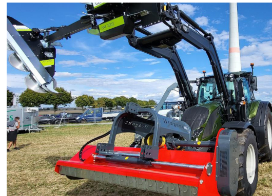
Sichelmulcher als Anbaugerät am Schlepper