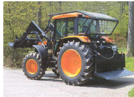
Landwirtschaftlicher Schlepper mit Forstausrüstung

Es gelten die Arbeitsschutzbedingungen beim Einsatz von Forstmaschinen. Sowohl die zur Maschine gehörigen Fahrer als auch die Fachberater Forst haben die im Umfeld der Forstmaschinen eingesetzten Einsatzkräfte der Feuerwehr auf die Arbeitsschutzbedingungen, insbesondere auf die notwendigen Sicherheitsabstände zu den Maschinen, hinzuweisen.